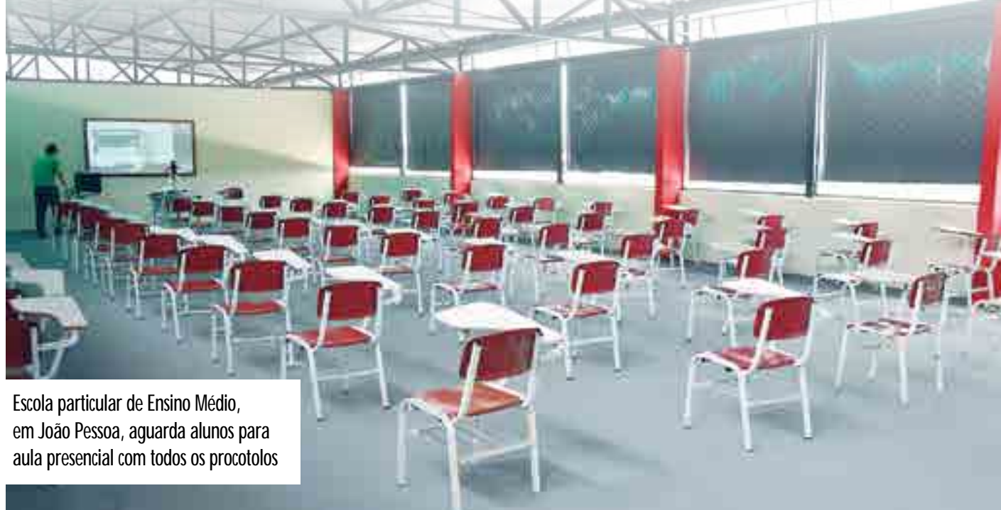
Escola particular de Ensino Médio, em João Pessoa, aguarda alunos para aula presencial com todos os protocolos

“Num país que mantém a última posição no ranking salarial entre as nações pesquisadas pela Organização para a Cooperação e Desenvolvimento Econômico, é lamentável que o Estado brasileiro insista em perseguir os/as professores/as e suas remunerações ainda rebaixadas”, relatou a nota.