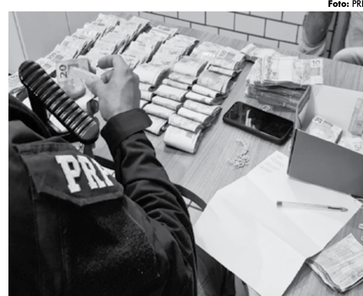
O condutor do veículo não explicou a origem do dinheiro apreendido

Em um fundo falso no painel do veículo foi localizado mais de R$ 128 mil. O condutor não explicou a origem do dinheiro, apenas que pegou a quantia em Natal (RN), e entregaria na capital paraibana. Ele não possui antecedentes criminais, mas se recusou a passar detalhes sobre o dinheiro escondido. Ele foi conduzido à Polícia Federal e responderá pelos crimes de lavagem de dinheiro e violação da suspensão de dirigir, já que estava com a habilitação suspensa.