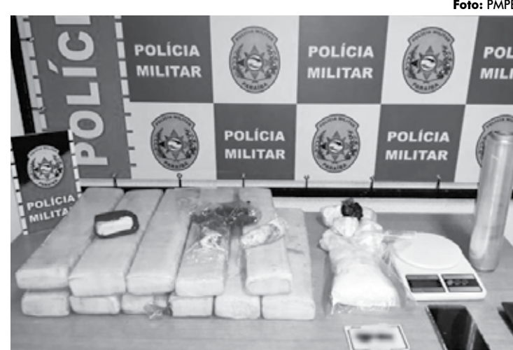
O homem com a droga foi abordado por policiais do BEP Motos em Paratibe

O preso, que já tinha passagem pela polícia por tráfico e estelionato, foi apresentado com o material na Central de Flagrantes, no Geisel.