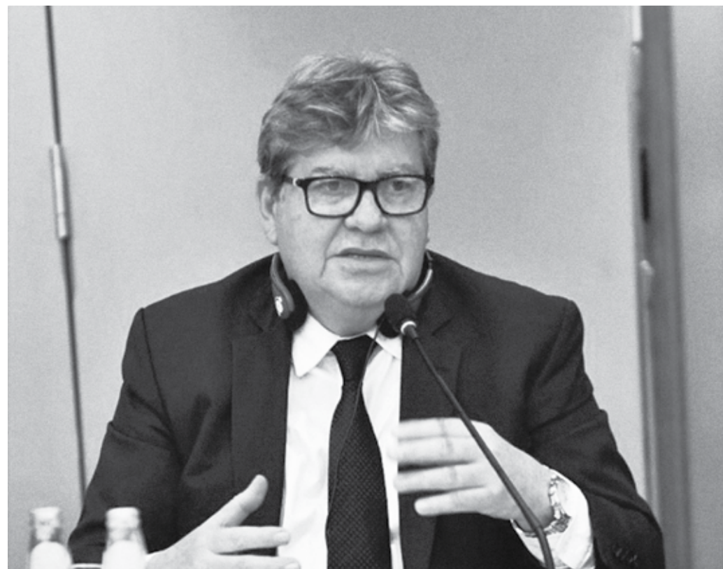
Governador João Azevêdo visitará obras em Patos cujos investimentos somados atingem R$ 189 milhões